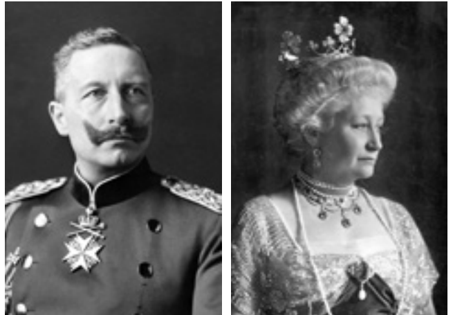
Ο γερμανός αυτοκράτορας Γουλιέλμος II και η σύζυγός του, Βικτώρια Αυγούστα

Τον Σεπτέμβριο του 1934, σε μια ομιλία του ενώπιον των μελών της οργάνωσης Εθνικοσοσιαλιστριών γυναικών, ο Χίτλερ υποστήριξε ότι ο κόσμος της γερμανίδας γυναίκας έπρεπε να περιορίζεται «στον σύζυγο, στην οικογένεια, στα παιδιά και στο σπίτι!» Η έκφραση «παιδιά και κουζίνα» κυ-