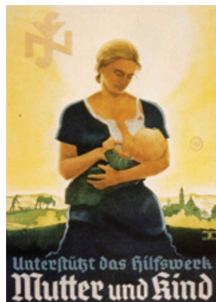
Προπαγανδιστικές αφίσες της ναζιστικής Γερμανίας