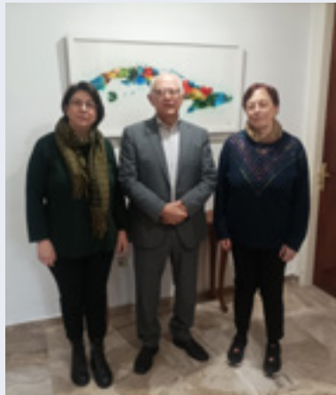
Συνάντηση έκφρασης αλληλεγγύης στον κουβανικό λαό από την Πρόεδρο και την Αντιπρόεδρο της ΟΓΕ στον Πρόεδρο της Κούβας στην Αθήνα

Καταδικάζουμε τη νέα κλιμάκωση της επιθετικότητας του αμερικανικού ιμπεριαλισμού κατά της κυριαρχίας και