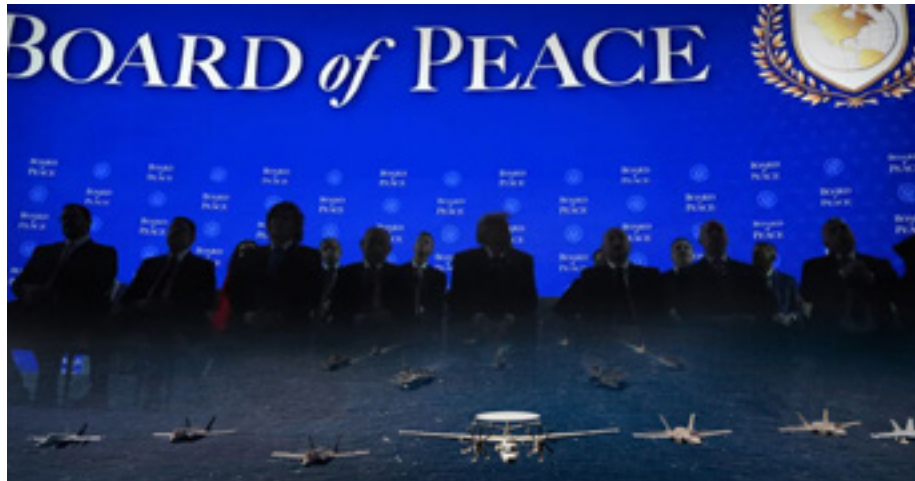
Το Συμβούλιο Ειρήνης των μακελάρηδων για τα νοσηρά σχέδια στη Γάζα ενώ οι ΗΠΑ δηλώνουν έτοιμες για επίθεση στο Ιράν

Δεν θα επιτρέψουμε στην κυβέρνηση να στείλει στρατό στην αιματοβαμμένη Γάζα, όπως ήδη ετοιμάζεται, με τον μανδύα του «ειρηνοποιού». Δεν έχουν καμία δουλειά Έλληνες στρατιωτικοί να βάψουν τα χέρια τους με το αίμα των Παλαιστινίων. Η «δύναμη σταθεροποίησης» που ετοιμάζεται υπό την ηγεσία των ΗΠΑ θα αναλάβει ρόλο τοποτηρητή, είναι δύναμη κατοχής, υποστηρικτική στον ισραηλινό στρατό, που συνεχίζει να δολοφονεί αμάχους, μάνες και παιδιά. Οι δολοφόνοι επιστρέφουν στον τόπο του εγκλήμα-