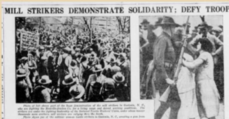
8 Απριλίου 1929 - αλληλεγγύη στους απεργούς του Loray

ται να θρέψει τα πολλά παιδιά της κάτω από άθλιες συνθήκες, συμμετέχει στην απεργία και αναδεικνύεται σε ηγετική μορφή. Προωθεί την ταξική ενότητα πέρα από φυλετικές διακρίσεις, οργανώνοντας και Αφροαμερικανούς εργάτες. Η κορύφωση του μυθιστορηματος ακολουθεί την ιστορική πραγματικότητα: η Μπόνι δολοφονείται από μπράβους κατά τη διάρκεια της απεργίας, ακριβώς όπως η Ελλα. Στο κείμενο ενσωματώνονται μπαλάντες και τραγούδια που παραπέμπουν σε εκείνα που έγραφε η Γουίγκινς για να εμψυχώσει τους εργάτες. Το έργο απέσπασε το βραβείο Γκόρκι το 1933.