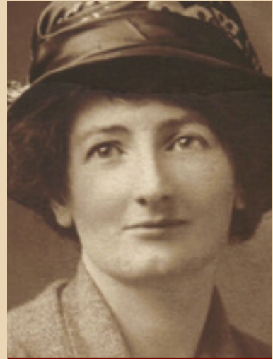
Ρεμπέκα Χάρντινγκ Ντέιβις

Η Έστερ και η Ρέιτσελ ζουν με τη μητέρα και τη γιαγιά τους. Είναι δύο εκ διαμέτρου αντίθετοι χαρακτήρες. Η μία –ευγενική, χαρισματική μουσικός– αναζητά την ασφάλεια και την ηρεμία. Η άλλη, ανήσυχη και αποφασιστική, υποστηρίζει με σθένος την κοινωνική και πολιτική αλλαγή για το σύνολο των καταπιεσμένων εργατών. Η ζωή τους, όπως των υπόλοιπων εργατικών οικογενειών, είναι ένας διαρκής αγώνας για την επιβίωση. Όταν η γιαγιά τους πεθαίνει, δεν έχουν τα χρήματα ούτε για να τη θάψουν... Μπροστά σε αυτή την τεράστια κρίση, οι δύο αδελφές παίρνουν αποφάσεις που καθορίζονται από τις επιλογές καθεμιάς και θα σημάδεψουν ανεξίτηλα την υπόλοιπη ζωή τους. Η Έστερ παντρεύεται κάποιον παράγοντα της κλωστοϋφαντουργίας χωρίς αγάπη και μπαίνει με στωικότητα σε έναν διαφορετικό κύκλο δουλείας. Η Ρέιτσελ διαβάζει το «Κεφάλαιο» και ονειρεύεται μια καλύτερη ζωή. Η συγγραφέας περιγράφει με λυρισμό τα όνειρά της και με ρεαλισμό τις σκέψεις της: « Το να λιμοκτονούν ήσυχα, διακριτικά και χωρίς επίδειξη, είναι ίσως η μεγαλύτερη τέχνη που έχει επιβάλει ο πολιτισμός στις μάζες ».