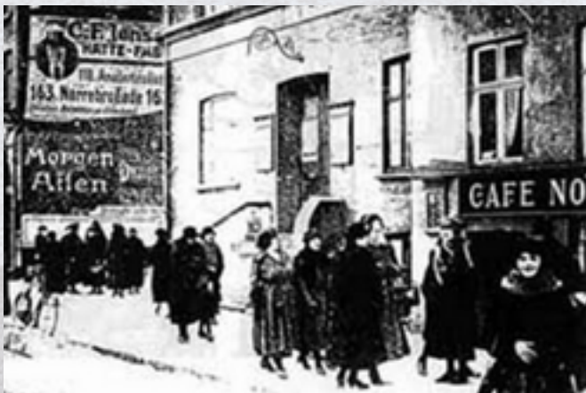
2η Σοσιαλιστική Διεθνής, Κοπεγχάγη

Η Παγκόσμια Ημέρα της Γυναίκας καθιερώθηκε επίσημα στη Δεύτερη Διεθνή Διάσκεψη Σοσιαλιστριών Γυναικών στην Κοπεγχάγη της