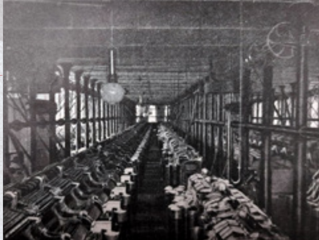
Το κλωστήριο του εργοστασίου Krenholm τον 19ο αιώνα

πρόστιμα τα οποία συχνά εξαφάνιζαν το μισό μεροκάματο των εργατριών!). Ο νόμος παρουσιάστηκε ως «φιλανθρωπία» του Tsάρου, μα ο πραγματικός στόχος ήταν να κατευναστούν τα οξυμένα πνεύματα. Η κυβέρνηση φοβόταν ότι, αν οι γυναίκες συνέχιζαν να πρωτοστατούν σε βίαιες εξεγέρσεις, η κοινωνική σταθερότητα θα κατέρρεε. Στην πράξη, άλλωστε, οι βιομήχανοι συχνά παρέκαμπταν τον νόμο παίρνοντας ειδικές άδειες –ισχυρίζονταν πως η απαγόρευση έπληττε την ανταγωνιστικότητά τους. Ωστόσο, η θέσπιση του νόμου απέδειξε στις εργάτριες πως η μαζική διεκδικητική δράση μπορούσε να επιφέρει βελτιώσεις στην άθλια καθημερινότητά τους.