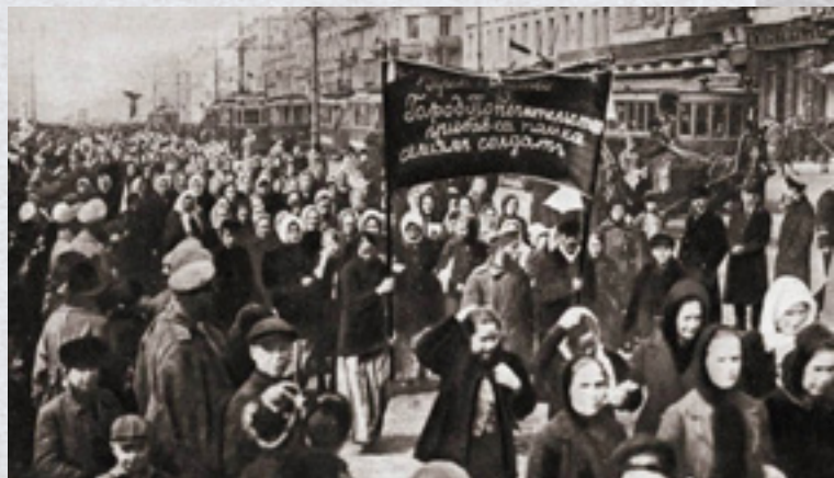
Γυναικεία διαδήλωση στους δρόμους της Πετρούπολης στις 23 Φεβρουαρίου (8 Μαρτίου) 1917